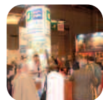
Le département s'affiche Page 2