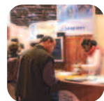
Entreprises au salon Page 3